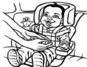
Límites personales: asiento para el auto/correas //cinturón de seguridad