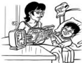
Límite personal: reglas sobre la hora de acostarse