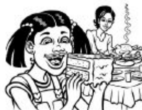
Límite personal: reglas sobre la cena y los postres