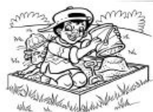
Límites personales: paredes de una caja de arena