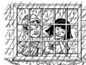
Límite personal: jugar afuera