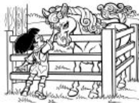
Límites personales: cercas